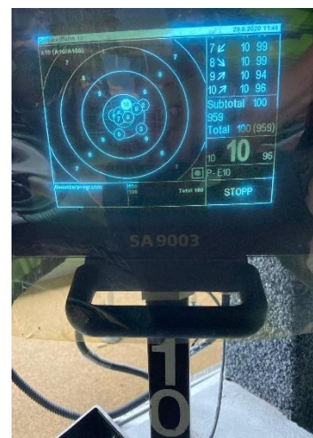
Öskis 100er 😊

Für den Schweizerischen-Final sind wir auf dem 12. Schlussrang, um 2 Ränge nicht qualifiziert.